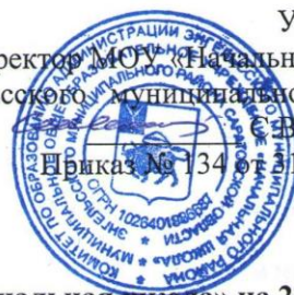
График проведения оценочных процедур в МОУ «Начальная школа» на 2022-2023 учебный год уровень начального общего образования